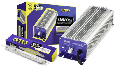
Lumatek CMH 630W Kit ( Ballast-Lamp)