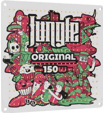
Jungle LED The Jackson 150W Original